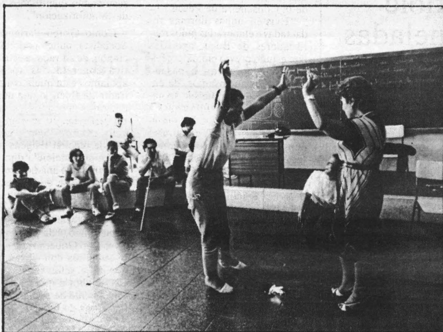
Nótase unha certa diminución dos asistentes as Escolas de Verán.

As E.V., naceron durante a dictadura franquista como plataformas políticas, clandestinas ou semiclandestinas, nas que as distintas forzas sociais, sindicais e políticas vencelladas ao mundo do ensino converxían para preparar alternativas. Froito deste traballo foi a proposta de ESCOLA PUBLICA, eixo que moveu tódalas Escolas de Verán e os M.R.P.S., durante a transición política. A reflexión xeral sobre o sistema educativo, as relacións escola-sociedade, o problema da selectividade, o corpo único de ensinantes, a construción e democratización dunha escola pública de calidade eran algunhas das preocupacións sobranceiras das primeiras edicións destas escolas en Galicia. Bo exemplo que respondía a este modelo de plataforma foron as Primeiras Xornadas do Ensino "celebradas" en Maceda, agora hai dez anos.